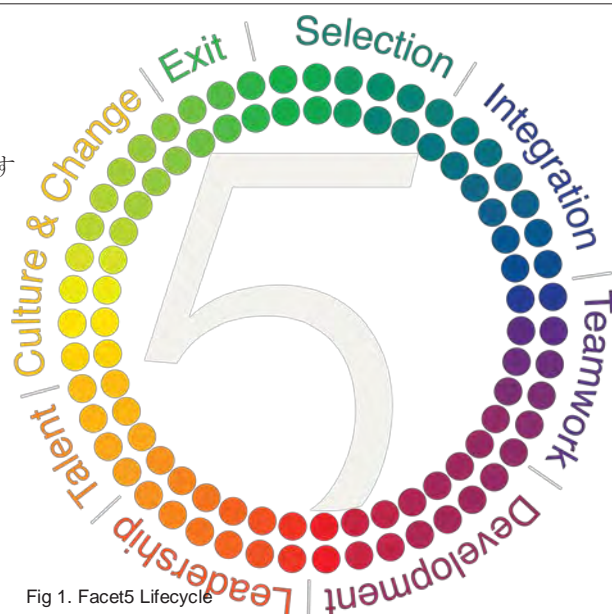
Fig 1. Facet5 Lifecycle